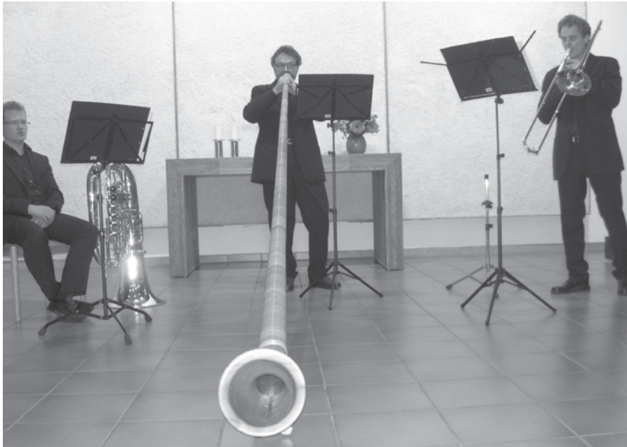
Beim Konzert von PhiLowBrass am 6. November

“Go, tell it on the mountain, that Jesus Christ was born ... !” Komm, sag es allen weiter, dass Je- sus Christus geboren wurde ... ! Wir laden ganz herzlich ein, die Weihnachtsbotschaft zu hören und weiter zu sagen.